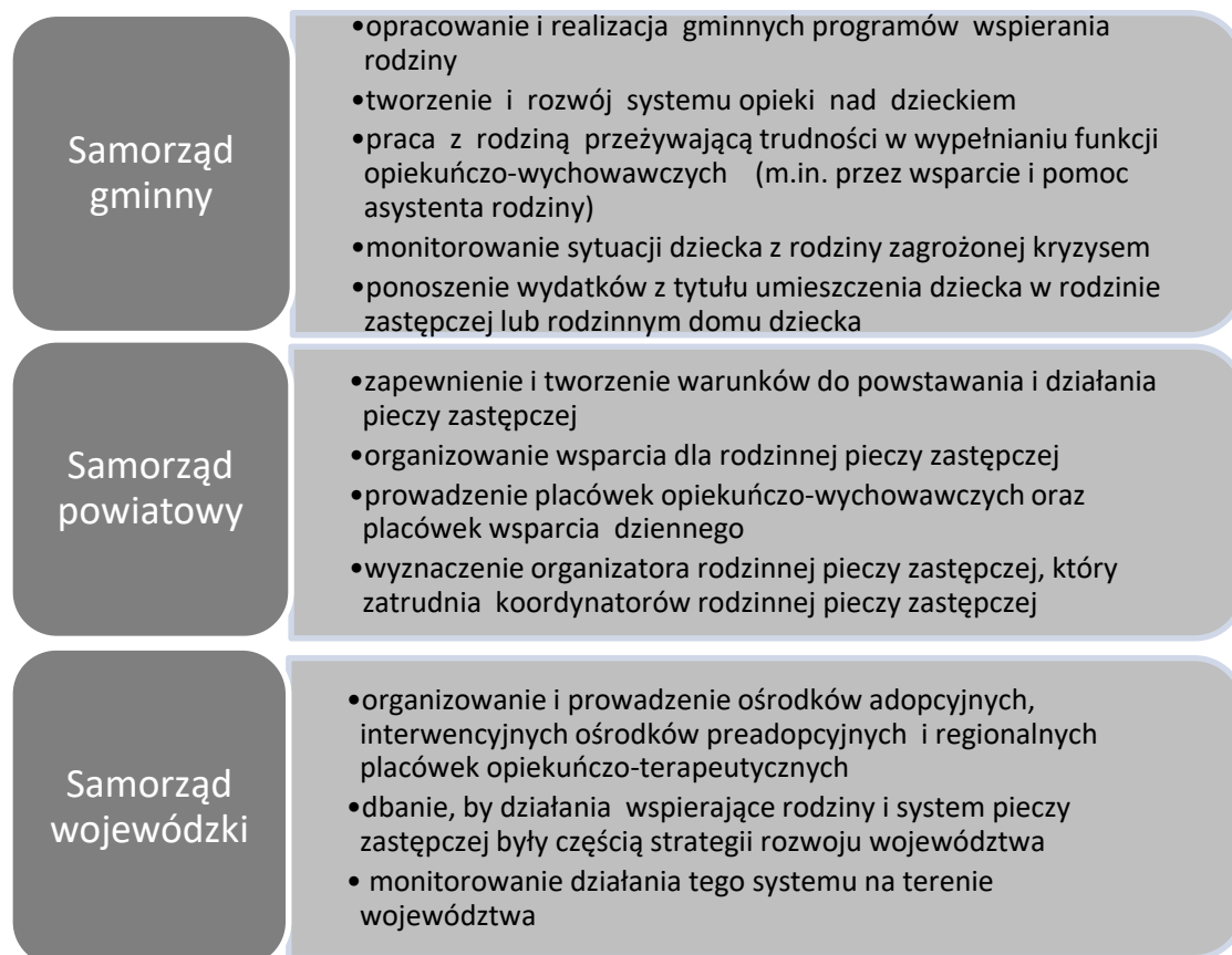
Diagram 1. Kompetencje w zakresie pomocy i wspierania rodziny w jej funkcjach.

Na poniższym rysunku przedstawiono rozdział kompetencji w tej dziedzinie pomiędzy różne szczeble samorządu terytorialnego.